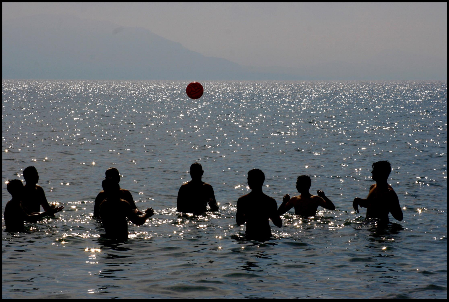
☺ Spiele. Dein Herz sehnt sich nach dem Funkeln kindlicher Unbefangenheit und Unbekümmertheit. ☺ Badende Männer genießen das wettkampflöse Ballspiel im flach abfallenden Strand bei Campofelice de Rocella (Nordküste) – Juni 2014